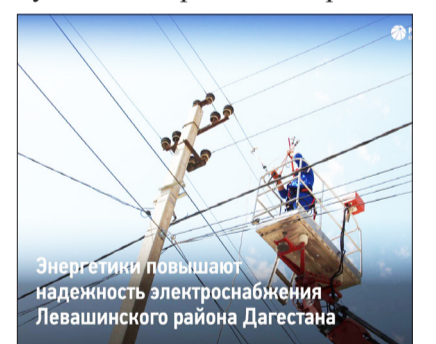
Энергетики повышают надежность электроснабжения Левашинского района Дагестана

махи выполнен ремонт трансформаторного пункта мощностью 400 кВА, на котором происходили технологические нарушения. Здесь же на линии электропередачи специалисты заменили порядка 100 метров ветхого провода на более надежный и безопасный самонесущий изолированный провод.